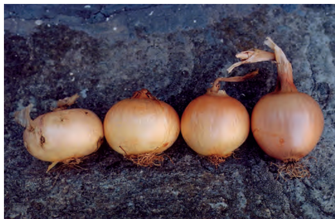
Oignons de Sisco

Par ailleurs, le retour de cédratières et l'arrivée de l'oignon de Sisco montrent bien le potentiel de développement d'une agriculture de niche. Développer ces derniers et d'autres produits peuvent être des axes valorisant l'agriculture capcorsine en la démarquant du reste de la Corse.