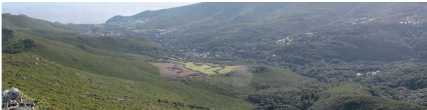
Parcellaire agricole dans la vallée de Sisco.

A l'occasion de l'inventaire des potentialités agricoles, il peut être réalisé une campagne d'information, et notamment, lors de l'identification d'agriculteurs non encore déclarés, une incitation à la déclaration, dans le but de pouvoir les aider en cas de problème et suivant leurs besoins, et de pouvoir les inscrire au sein des réseaux, répertoires, guides etc. déjà édités ou à venir.