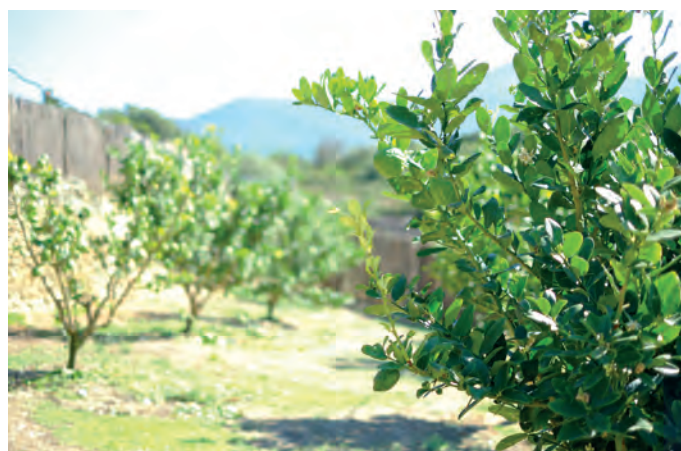
Cédrats à Barrettali